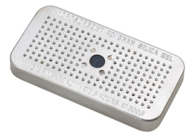
1500D El gel de sílice desecante Peli