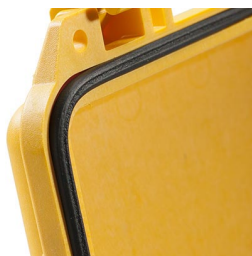
1753 Replacement O-ring