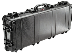
1700NF No Foam