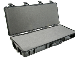
1700WF With Foam