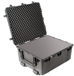
1690WF With Foam