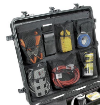
1699 Organizador de tapa