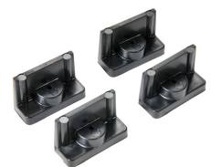
1507 Quick Mounts - set of 4