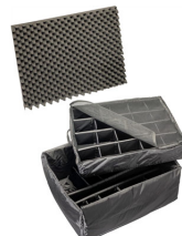
1695 Divisores acolchados