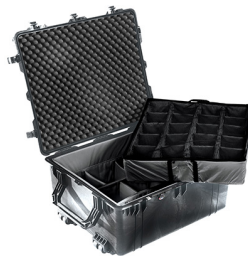
1694 With Padded Dividers