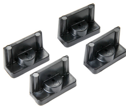
1507 Quick Mounts - set of 4