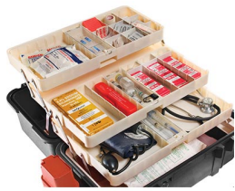
1466 Sistema de bandejas para 1460EMS