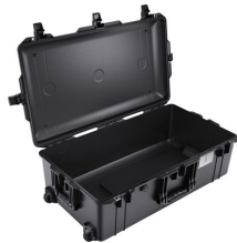
1615NF No Foam