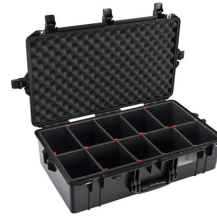
1605TP With TrekPak Divider System