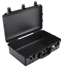
1555NF No Foam