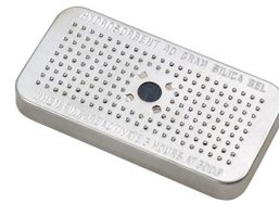
1500D El gel de sílice desecante Peli