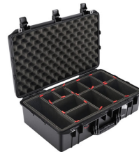
1555TP With TrekPak Divider System