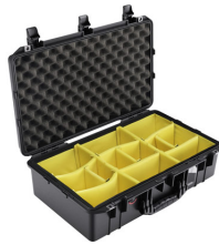
1555WD With Padded Dividers