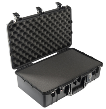
1555WF With Foam