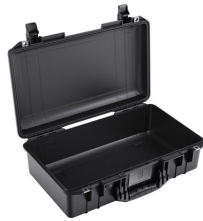
1525NF No Foam