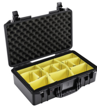
1525WD With Padded Dividers