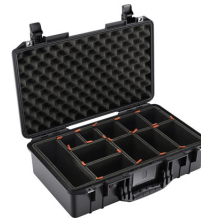
1525TP With TrekPak Divider System