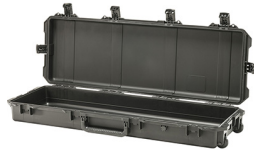
iM3200-X0000 No Foam