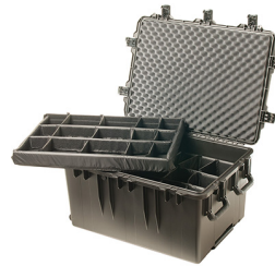
iM3075-X0002 With Padded Dividers