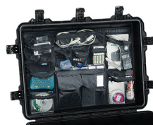
iM3075-UTILITYORG Organizador de accesorios