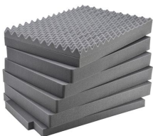
iM3075-FOAM Juego de 7 piezas de espuma de recambio