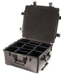
iM2875-X0002 With Padded Dividers