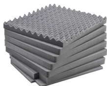
iM2875-FOAM Juego de 7 piezas de espuma de recambio