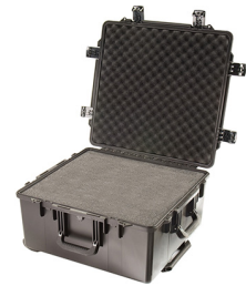
iM2875-X0001 With Foam