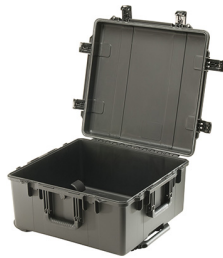
iM2875-X0000 No Foam