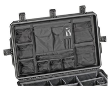
iM2875-UTILITYORG Organizador de accesorios