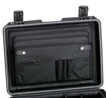
iM26XX-LIDORG Organizador de tapa