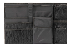
iM26XX-UTILITYORG Organizador de accesorios