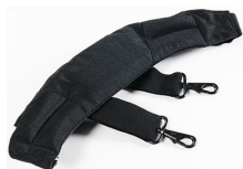
iM2370-STRAP-S Correa para hombro acolchada removible