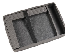
iM2370-COMPTRAY Bandeja para portátil