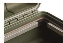
iM2306-MBEZ-B Instalaciones electrónicas básicas (métricas)