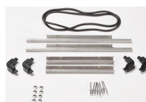
iM2306-M4-BEZEL-L Instalaciones electrónicas con tapa (métricas)