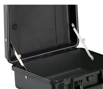
iM-LIDSTAY Soporte de tapa