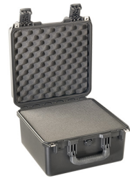
iM2275-X0001 With Foam