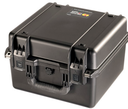
iM2275-X0000 No Foam