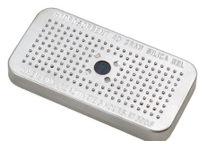
1500D El gel de sílice desecante Peli