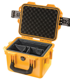
iM2075-X0002 With Padded Dividers