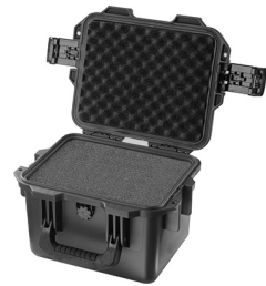
iM2075-X0001 With Foam