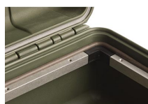
iM20XX-M4-BEZEL Instalaciones electrónicas básicas (métricas)