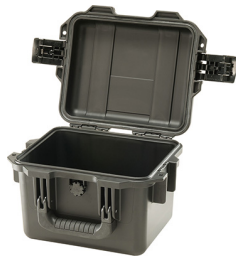
iM2075-X0000 No Foam